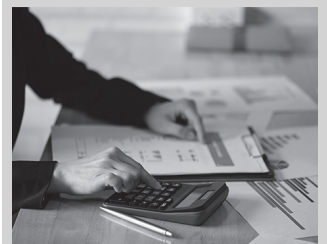
Autolikidazio proposamenak onartzeko epea apirilaren 3an zabalduko da.