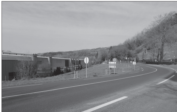
Mozketa Atxegaldetik Orioko Txankako biribilgunera luzatuko da.

Mozketa Atxegaldetik hasi eta Orioko Txankako biribilgunera bitartean izango da. Mozketa- ren muturrak mugitzeko aukera egongo dela diote, lanek aurrera egin ahala, moztutako errepide zatia ahalik eta gehien